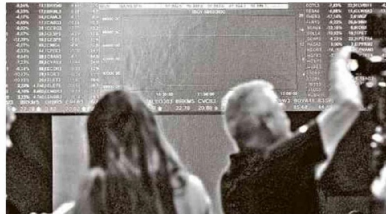
Los trabajadores colombianos enviaron una cifra sin precedentes al país.

Las remesas a Colombia llegan principalmente desde Estados Unidos y España, aunque en los últimos años también se ha visto un repunte de otros lugares como Chile, Ecuador, Argentina y Francia.