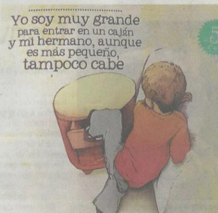
'Los cuentos de Juanita' abordan las historias cotidianas y los mundos fantásticos que imagina la autora con sus hijos, haciendo uso de fotografías convertidas en ilustraciones.