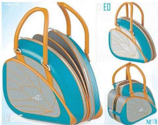
EL BOLSO cerrado refleja la mariposa en reposo y a medida que se abre las alas salen a flote.

468 creativos concurrieron y 13 fueron los finalistas.