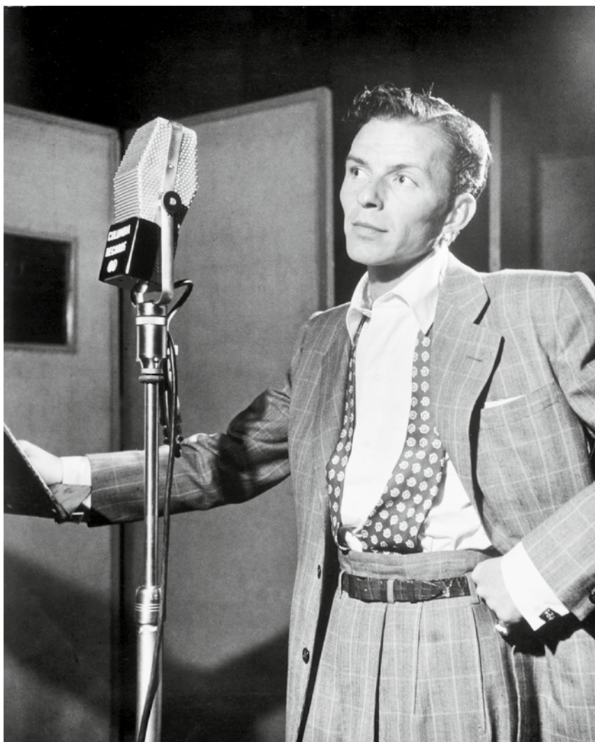
Frank Sinatra en Liederkranz Hall, Nueva York. 1947.